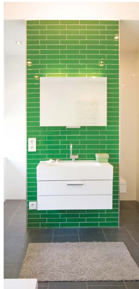
La parete verde del WC e della doccia creano una piacevole sensazione di rilassamento, per gli occhi.